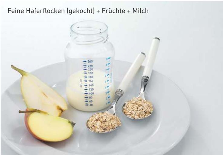
Feine Haferflocken (gekocht) + Früchte + Milch

Gegen Ende des ersten Lebensjahres erfolgt der Übergang von der Babykost zur Familienkost.