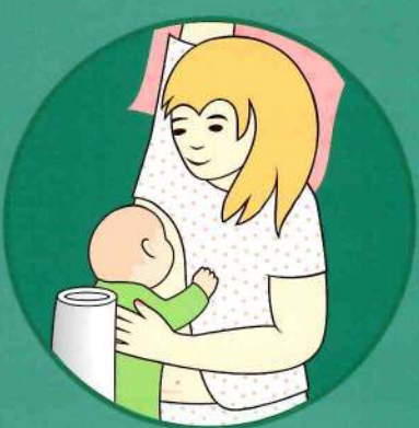
Stillen im Liegen